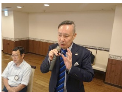
松下地区会員増強委員長より地区の報