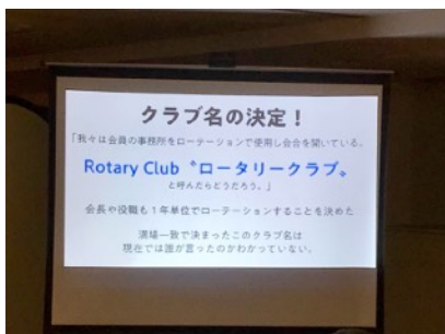
寺田会長挨拶は恒例のロータリーの歴史