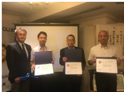
③PAUL HARRIS FELLOWに認証された皆様