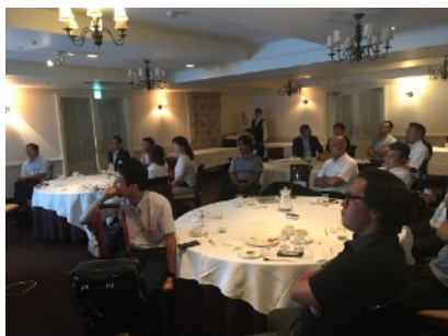
⑥市島会員の卓話に聞き入る皆様