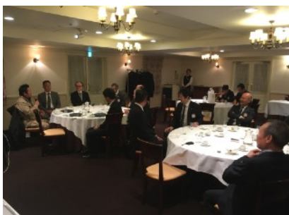
⑤卓話に聞き入る会員一同