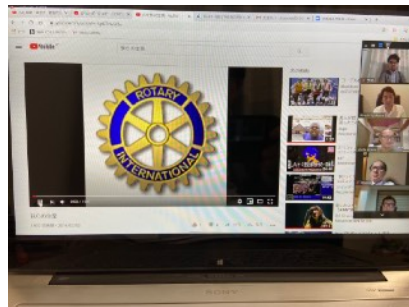
②ロータリーソング我らの生業