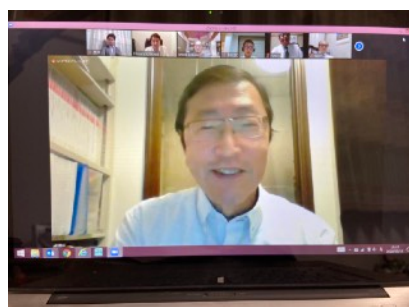
④5月お誕生日藤井会員より一言